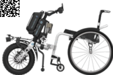
ICON 60 med PAWS