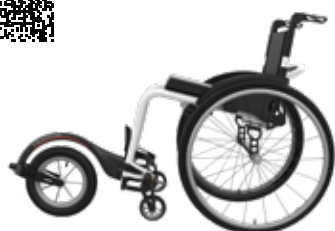
ICON 60 med Track Wheel